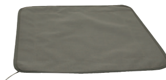
Mata z przewodem pętli