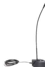
M-2 mikrofon na gęsiej szyjce