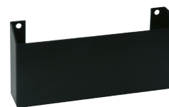
Uchwyt do montażu CLS-1